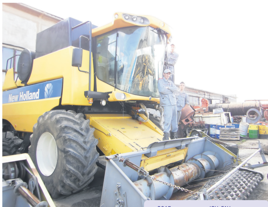
2015 год, студенты ЮУрГАУ на практике