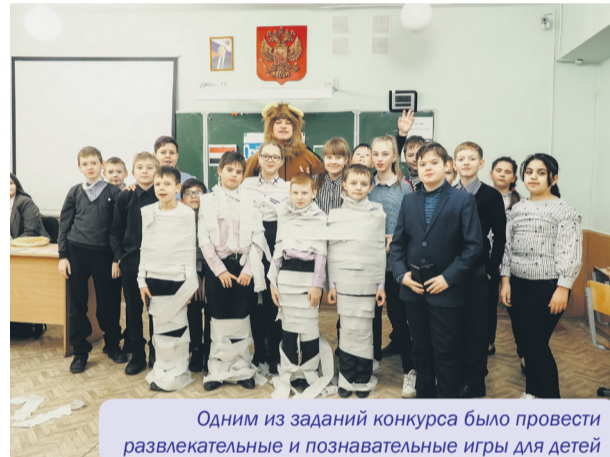
Одним из заданий конкурса было провести развлекательные и познавательные игры для детей

отрядах. Но нам удалось справиться и стать лучшим отрядом смены. Более того, именно на этой смене я занял первое место в конкурсе «Лучший вожатый смены «Капитаны счастливого детства». Благодаря этому мне предложили стать старшим вожатым на третьей и четвертой сменах.